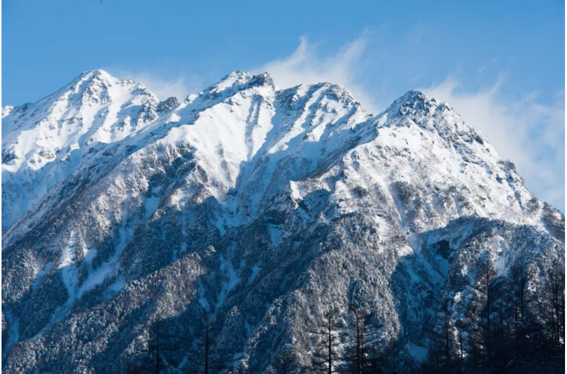
題名：『厳冬の明神岳』 場所：上高地にて

2013年度ハイキングリーダー養成学校入校案内 第31期（2013年度）アルパインリーダー養成学校 募集要項 丹沢・広沢寺の岩場清掃集会2013(第14回)3/3