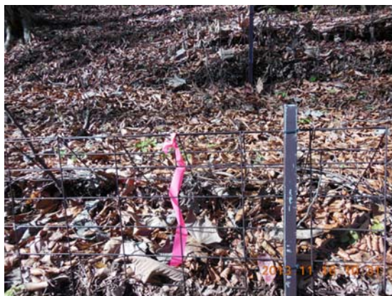
土壌流出防止対策の金網の柵