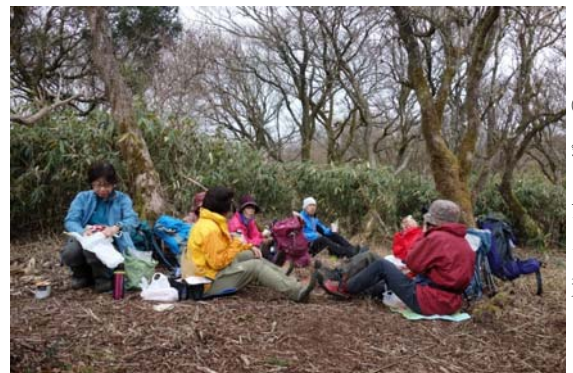
⑤白銀山山頂にて昼食

8日(日)今日は、地図にない道に行くバリエーションコースだ。タクシーで富士見台別荘地入口まで行き、当日参加の2名を加え15名で歩き始める。送電線の巡視路をたどり沢沿いに行くが箱根新道をくぐるトンネルを探すが見つからず、新道に上がり道路を横切って大観山北尾根の末端にとりついた。植林の山を登って大観山の駐車場に到着する。今日は曇り空で展望もイマイチ、富士山は見えず、芦ノ湖もぼんやりと見えるだけだ。ここから白銀山までは境界尾根沿いの道に行く。白銀山でお昼の後は、箱根湯本への道を少し進み、道を分けて尾根伝いの道を行くと御所山砦入口の標識があった、砦跡へと向かいまた戻り斜面を下りターンバイクに出た。道路に出る前に罫が仕掛けてあり、その中にイノシシが2匹掛っていた。桜山駐車場跡から先は、右手の玉川への下降場所を探したが、良い場所が見当たらずに苦労して下り、玉川の河原を歩いたり、藪を漕いだりと歩きやすそうな道を探しながら進んで行った。やっとターンバイクの高架下の舗装された林道に出た。その後は一夜城を見学するメンバーと帰宅または飲み会へ急ぐメンバーの2手に分かれ、私たちは石垣山城へと向かった。城跡を見学して、駅に向かう頃には夕暮れとなり、小田原の街の明かりを眺めながら早川駅に向かった。8時間以上になる長いVハイクは地形図を確認しつつ道を探しながらの、歴史と関白道を探究する一日となった。