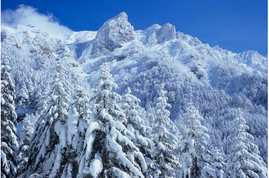
『吹雪去って』(南八ヶ岳・横岳にて)

広沢寺清掃集会 3月2日(日) / 第34期定期総会 3月9日(日) 2014年度21期ハイキングリーダー養成学校入校案内 / 日程及び内容 佐渡島山行案内 / 県労山の会クラブ組織数