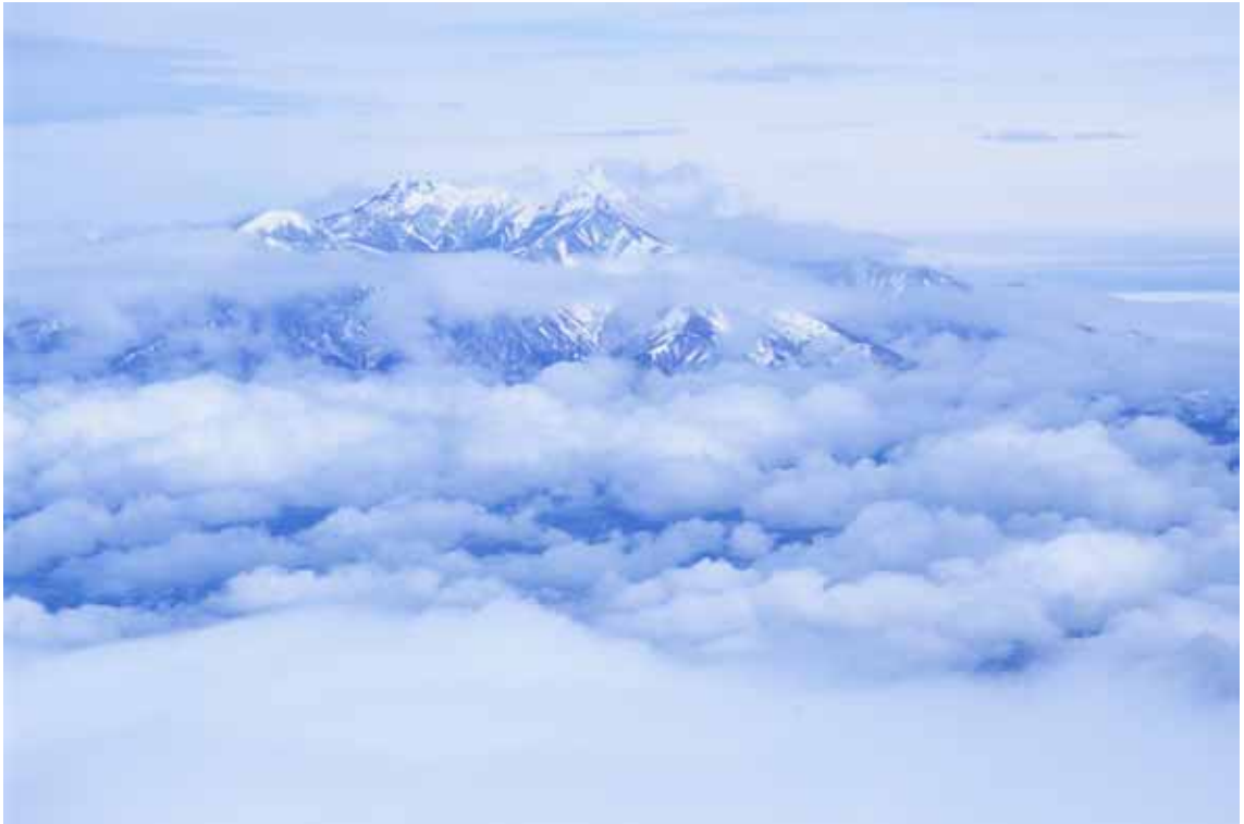
『雲上の八ヶ岳』南八ヶ岳・地藏岳にて