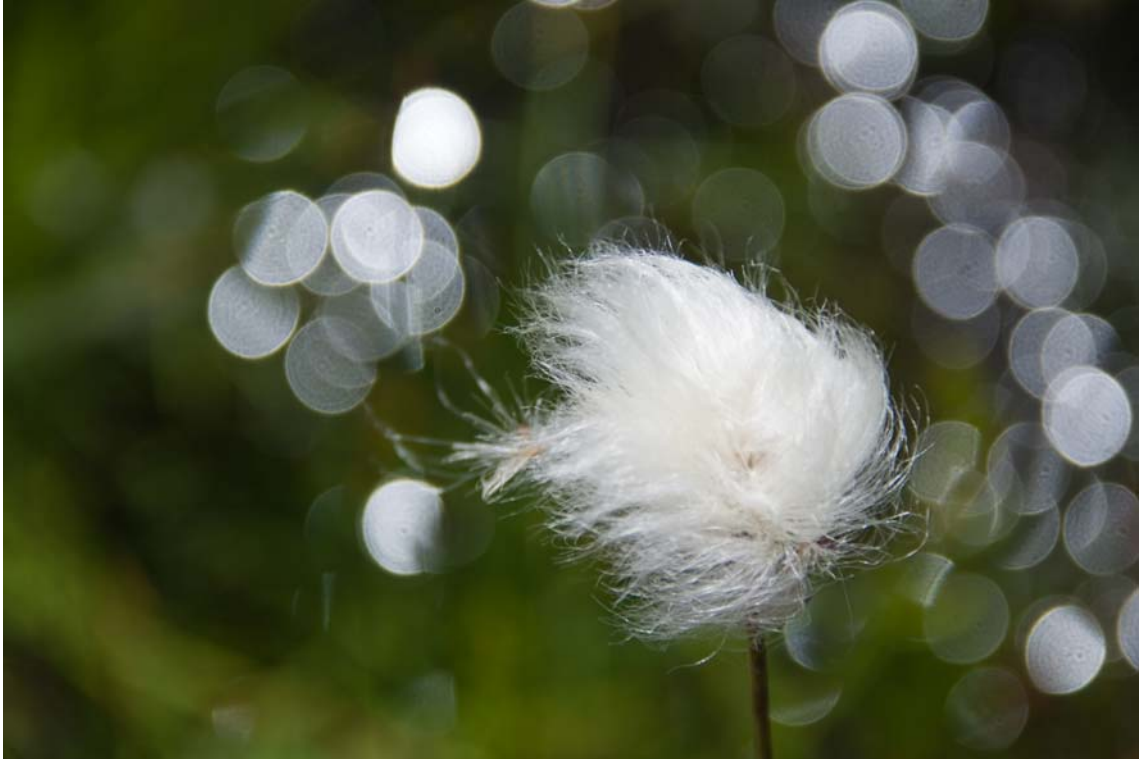
『ワタスゲのささやき』尾瀬ヶ原にて

第37回丹沢クリーンハイク報告 AED講習会案内6/25 ファーストエイド講習会案内6/29