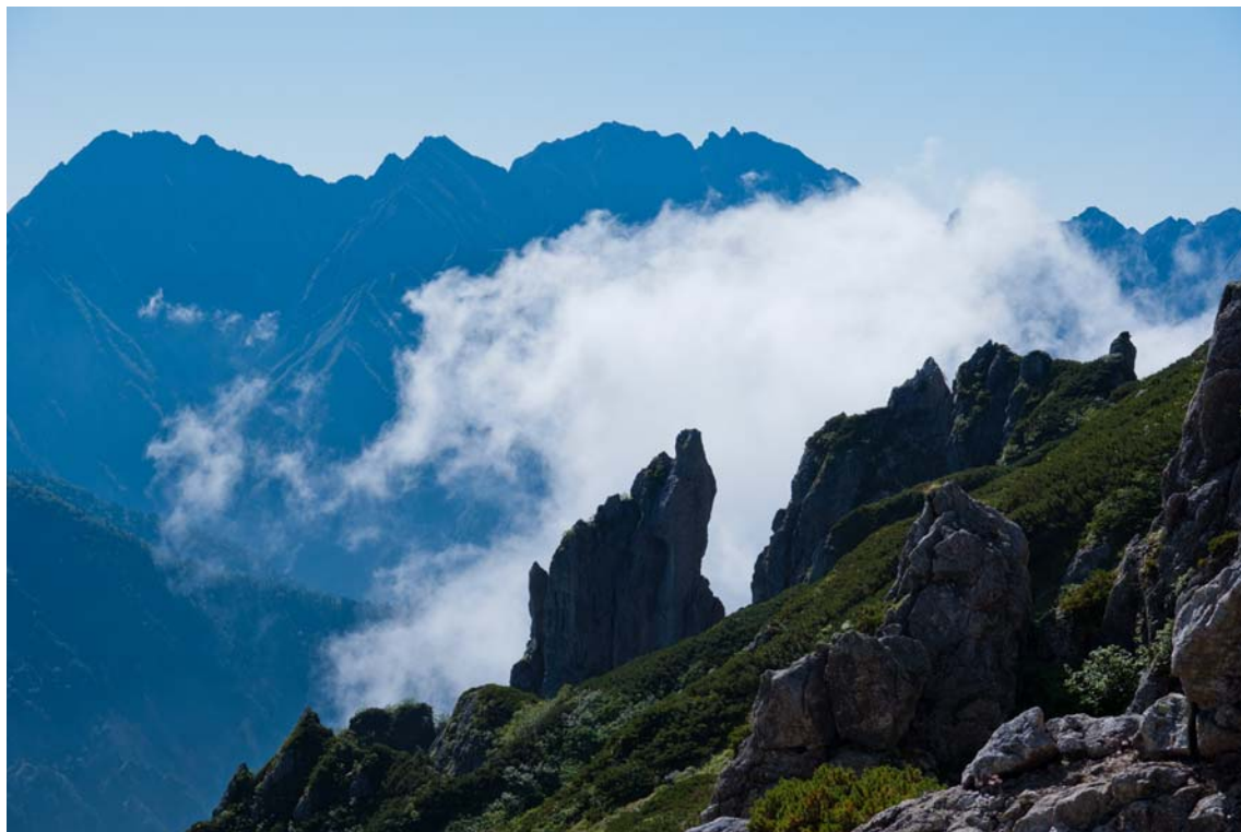
『奇岩と穂高稜線』笠ヶ岳中腹にて

震災ボランティア石巻・・・9月13日～15日 全国ハイキング交流集会09/27(土)-28(日) 「読図講習会」のご案内09/27(土)-28(日) 県連遭対部 公開ハイキング教室のお知らせ10月30日(机上)、11月9日(実技)