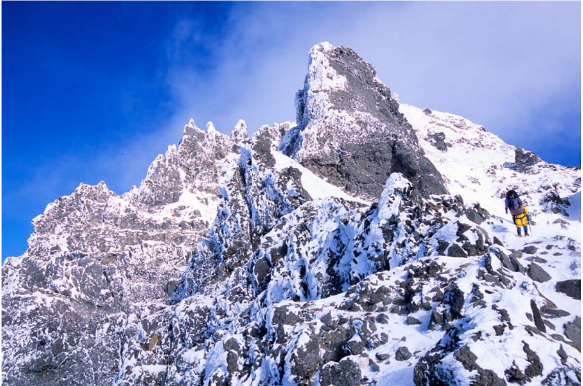
『厳冬の挑戦』南八ヶ岳・横岳にて

第22回関東ブロック「雪崩事故を防ぐための講習会」ご案内2015.1.17-18