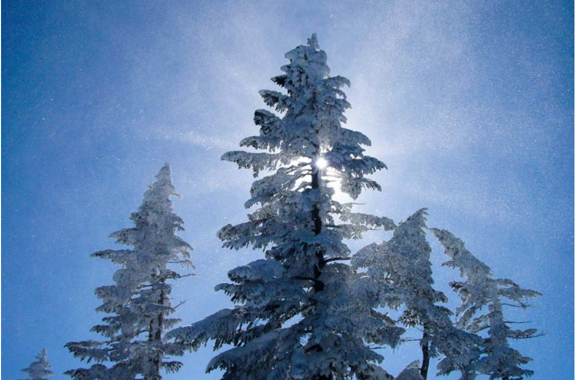
『粉雪のきらめき』長野県・横手山にて