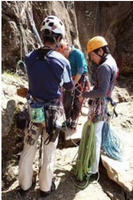
(ロープワークの基礎)