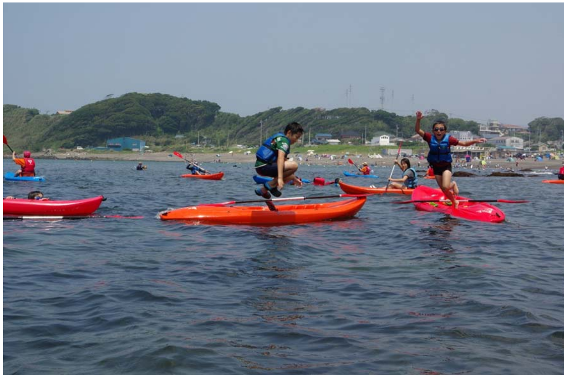
「山や海に行く。福島の子どもたちと夏休み保養プロジェクト in 三浦」

第2回「福島の子どもたちと夏休」保養プロジェクト報告 プロが教える 体験 安全登山講座 全五回