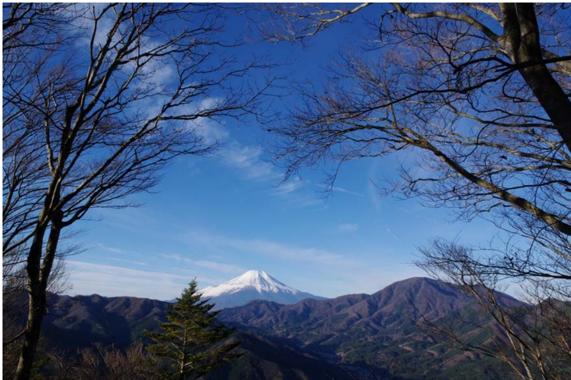
「冬の入り口 甲相国境鳥ノ胸山」