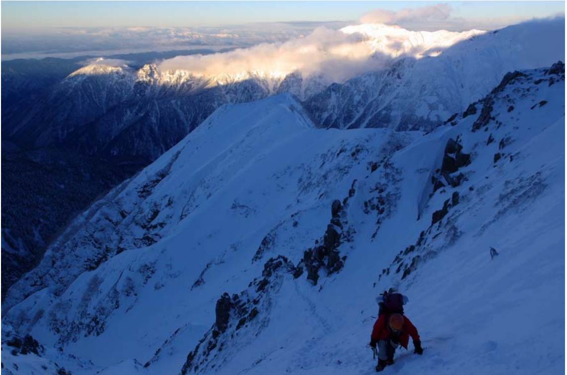
「黎明の稜線を目指して 涸沢岳西尾根」