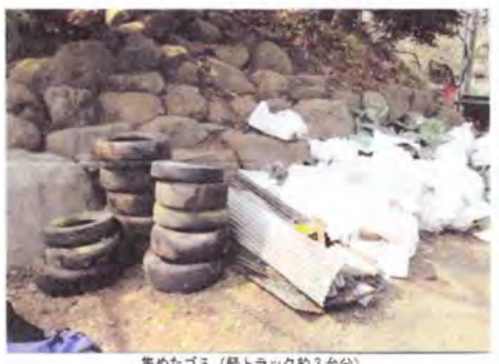
集めたゴミ(軽トラック約3台分)