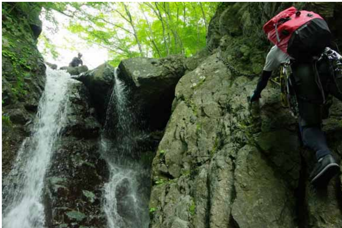
「丹沢クリーンハイク水質検査・水無川本谷」

熊本地震救援募金のお願いと送金方法(5月号参照) 「ファーストエイド講習会」のご案内7/9 「事故事例から学ぶ安全登山講習会(仮)」9/11