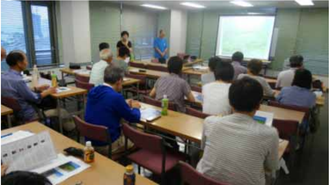
安全登山講習会「安全なハイキングのために」9/11

救助隊主催 ビバークと搬出講習会のご案内11/12-13 関東ブロック「雪崩事故を防ぐための講習会」2017/01/21-22