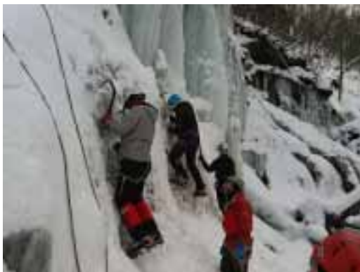
教育アイスクライミング

現在の柴笛クラブは、30名程度の小規模な会となっています。他会と同様に、会員の入れ替わりが多く、創立当初のメンバーは皆、60歳を超えてしまいました。とは言え残っている方はほとんどいません。したがって若い会員が会を支えており、特に、女性が運営の中心となっています。昔の柴笛のような山女、山男然とした、こわもてはおらず、優しく、知的なメンバーがきめ細かな取り組みをすすめています。