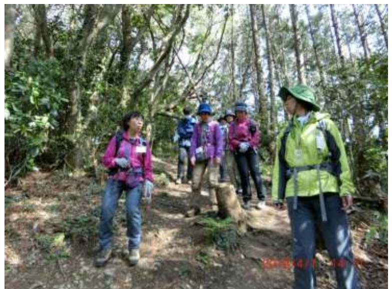
二子山の急な下り