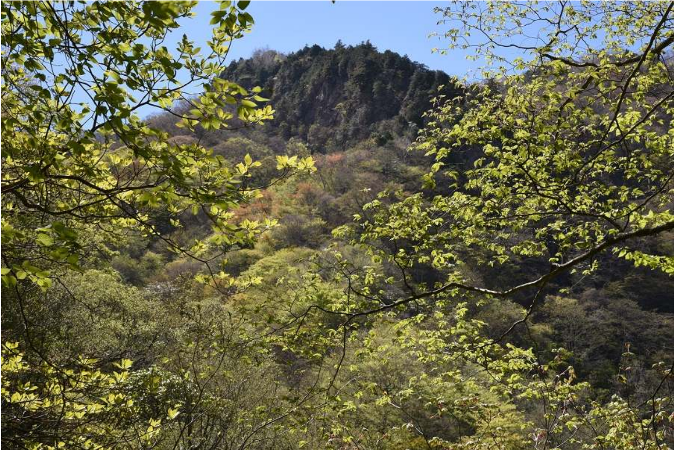
「新緑の山（両神山）」