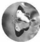
ミヤマモンキチヨウ