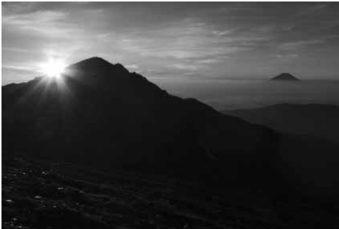
『南アルプス・中岳避難小屋より望む御来光、荒川岳そして富士山』