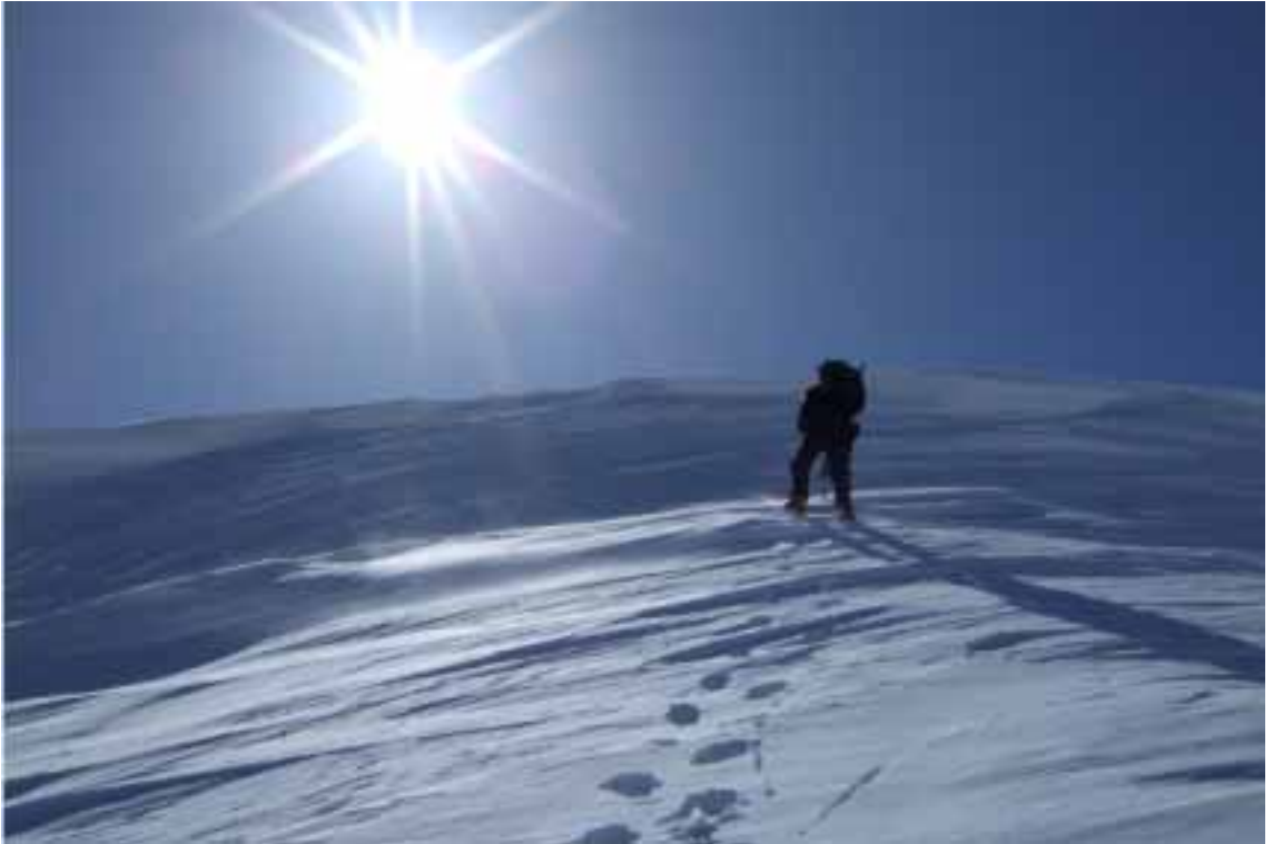
『厳冬の山頂を目指して』(北アルプス・爺ヶ岳東尾根にて)