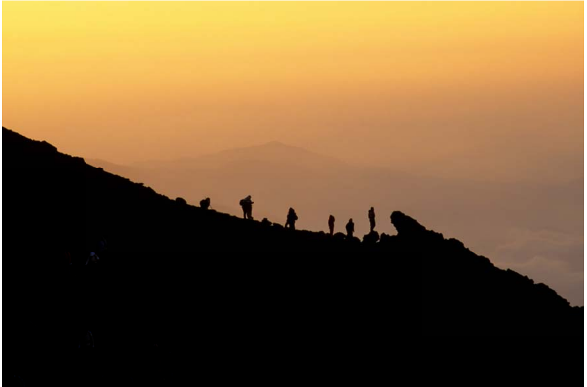
題名：『朝を待つ登山者たち』 場所：富士山8合目にて

臨時総会 9/11(火) 東日本大震災支援ボランティア 9/15(土)～9/17(月)