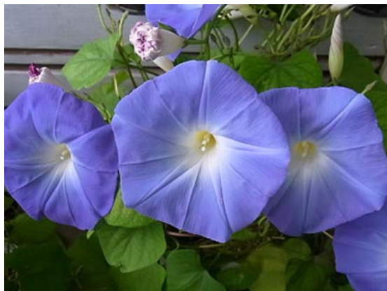
季節の花 300 より 「西洋朝顔」の「ヘブンリーブルー」