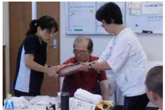
講師による模範演技

今回は最終日程の決定遅れによる不十分な案内期間等により、例年に比べ参加者が少なかった半面、参加者一人一人に丁寧な説明はでき、十分な理解が得られたものと考えている。このような講習は繰り返し受講して、いざというときにより効果的な手当てができるよう、当部会以外の講習会にも積極的に参加していただきたい。