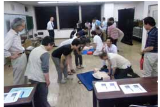
受講生による班ごとの実習