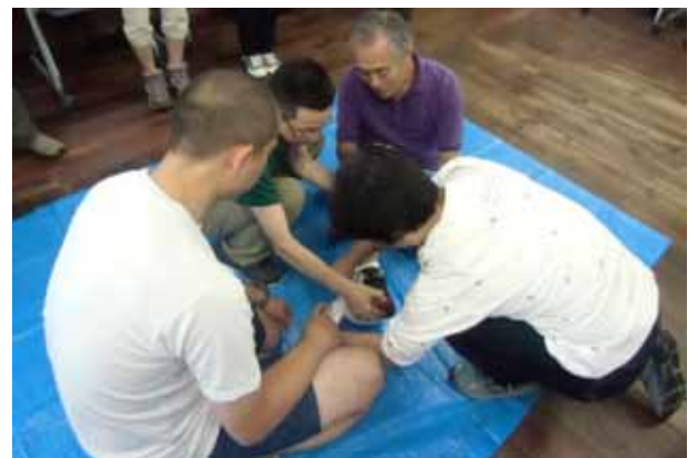
受講生による班ごとの実習