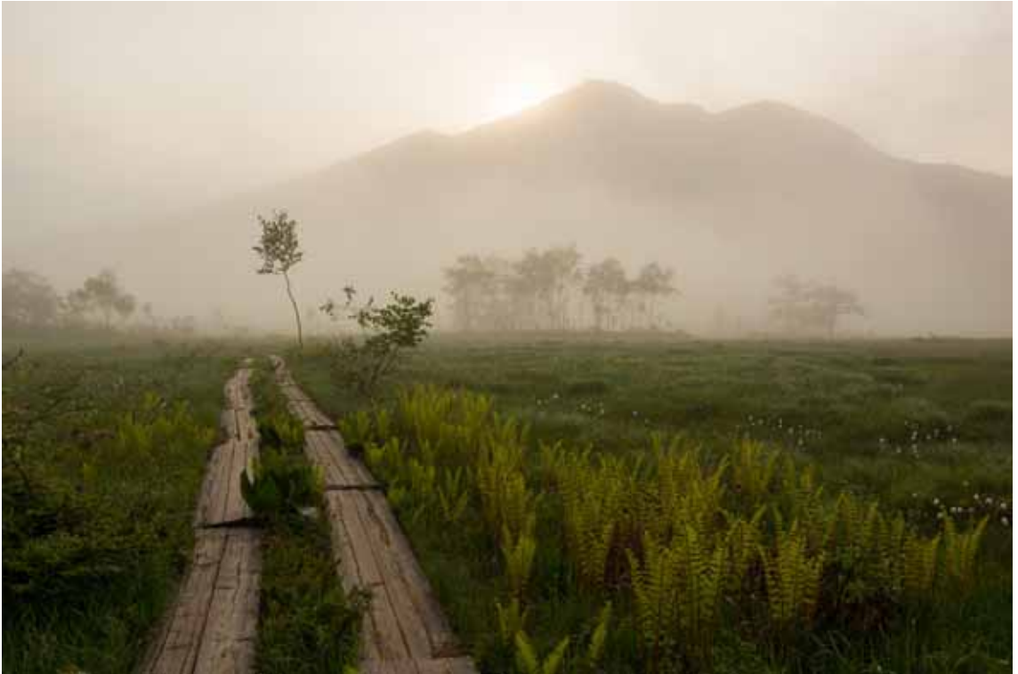
『朝もやと燧ヶ岳』尾瀬ヶ原にて

公開ハイキング教室のお知らせ10月30日(机上)、11月9日(実技) 関東B役員交流会 9月6日(土)～7日(日) 震災ボランティア石巻・・・9月13日～15日に実施予定 全国ハイキング交流集会09/27(土)-28(日) 「読図講習会」のご案内09/27-28