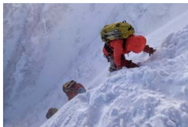
(時には厳しい条件下での行動も)