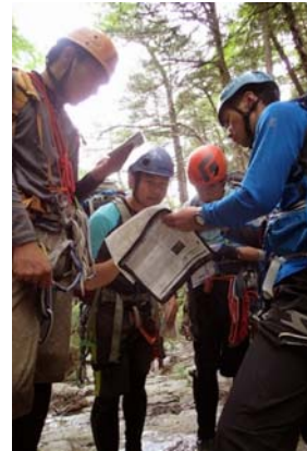
(パーティの意思疎通を図る)