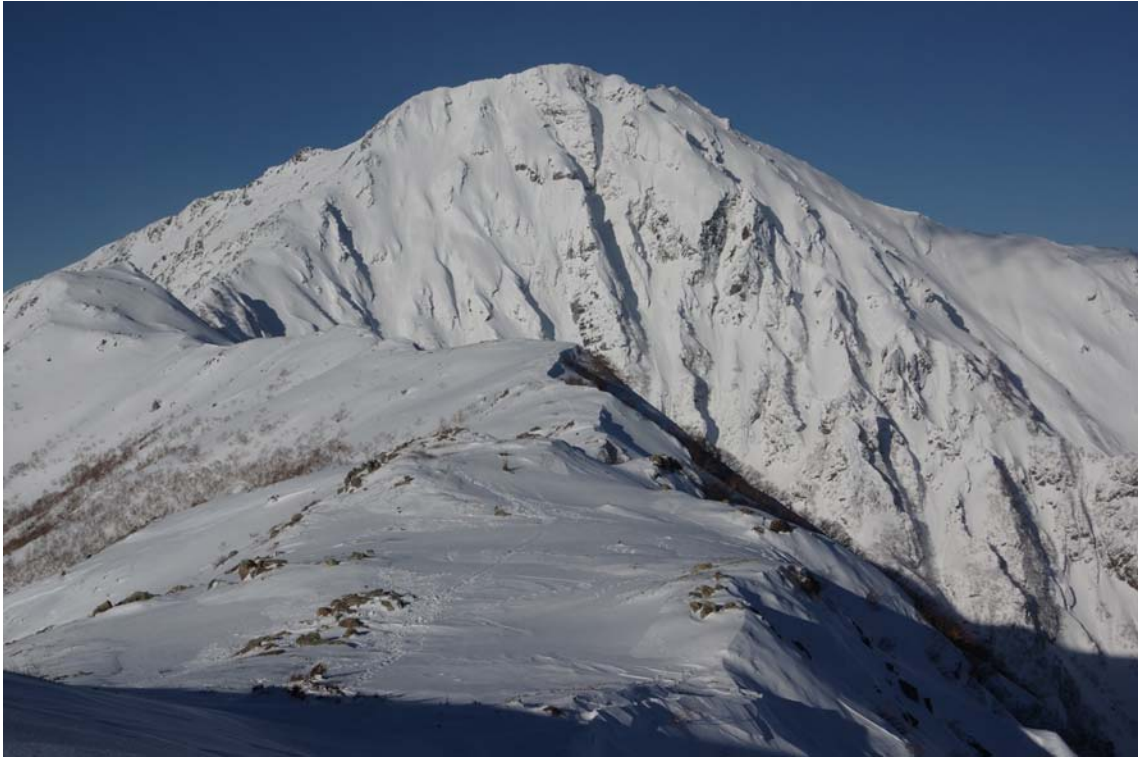
『白衣（びやくえ）の北岳』

2015年度ハイキングリーダー養成学校入校案内／日程 第33期(2015年度)アルパインリーダー養成学校募集要項