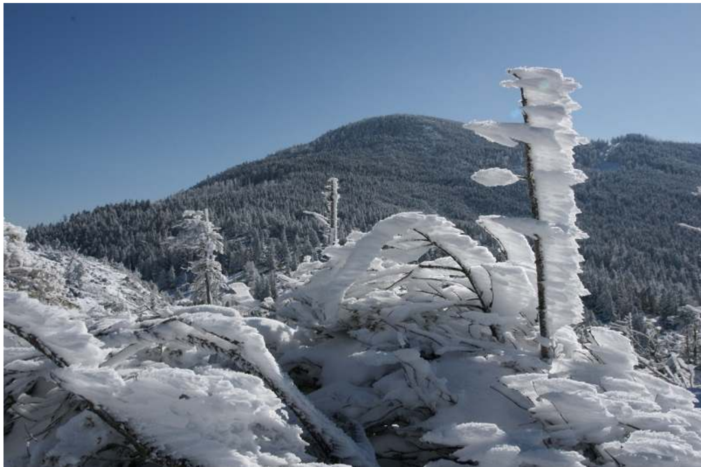
「冬の造形（縞枯山）」（川崎ハイキングクラブ 畑誠一）