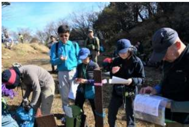
大山山頂で現在地・山座同定訓練