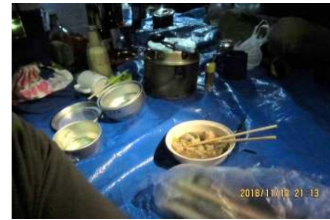
腕によりをかけて---