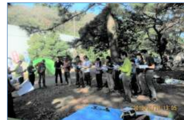
(1) 講習;ファーストエイド[止血・副木固定等応急処置] (説明) by 早川氏 ①テキスト説明