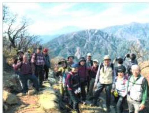
大山山頂からの眺望は素晴らしい

申込：宛先 bosyuu_sizen901@k-rouzan.net 件名：大山ハイク関根