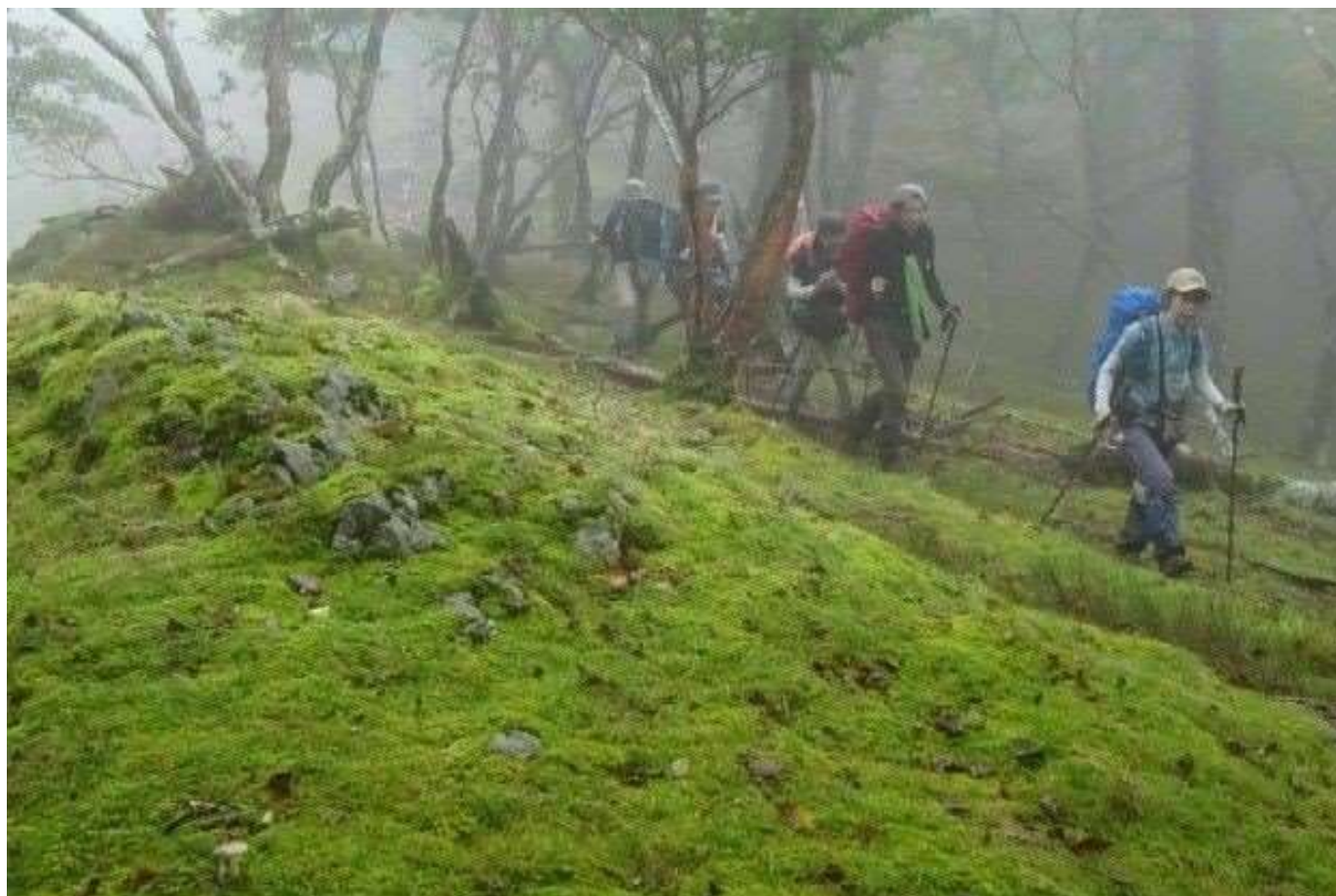
「熊野古道を歩く」(藤沢山の会 )