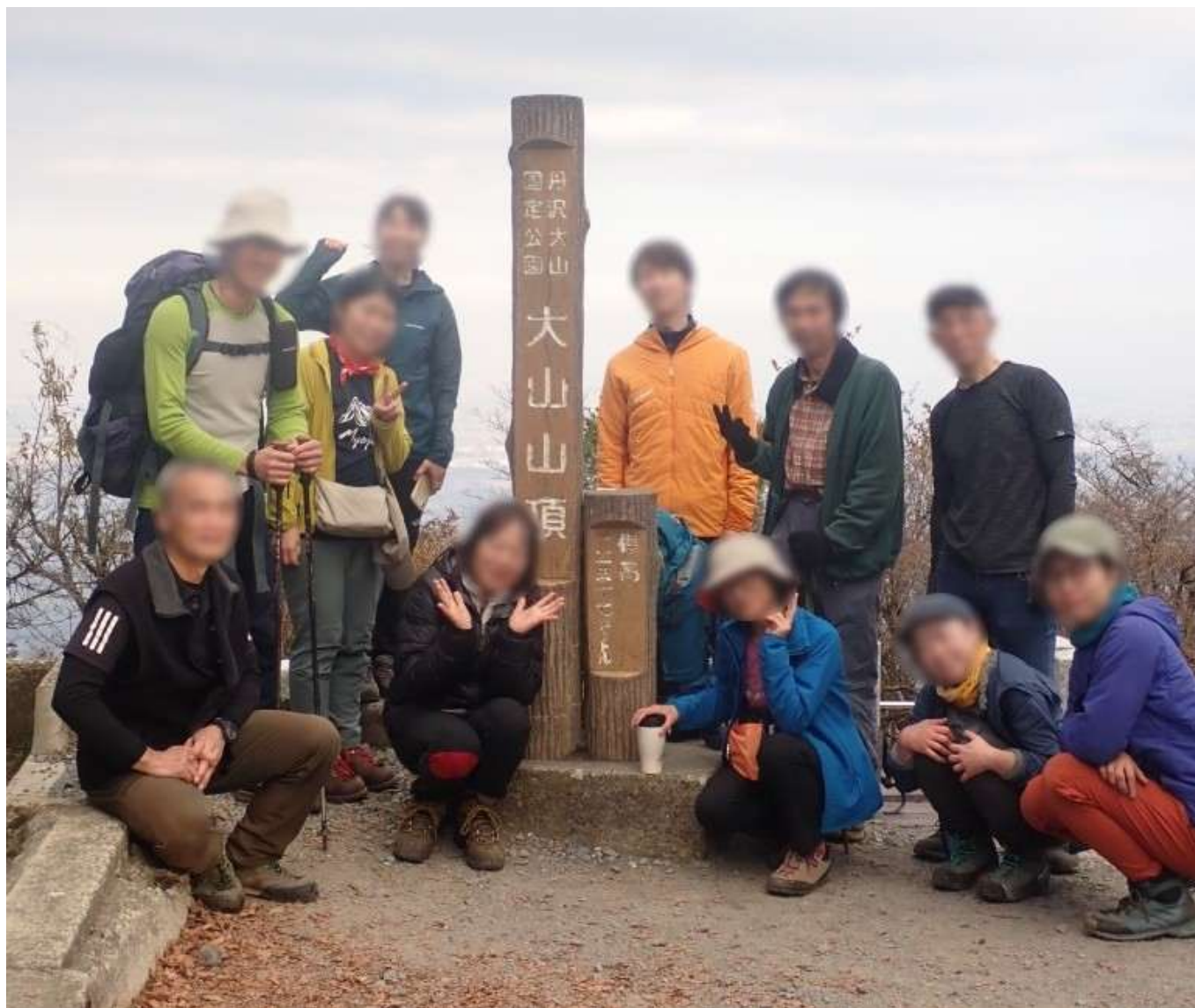
「毎年恒例の歩荷トレーニング（大山山頂）」（相模アルパインクラブ）