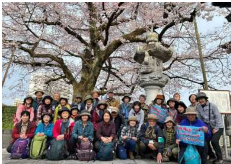
←大光寺の満開のエドヒガン