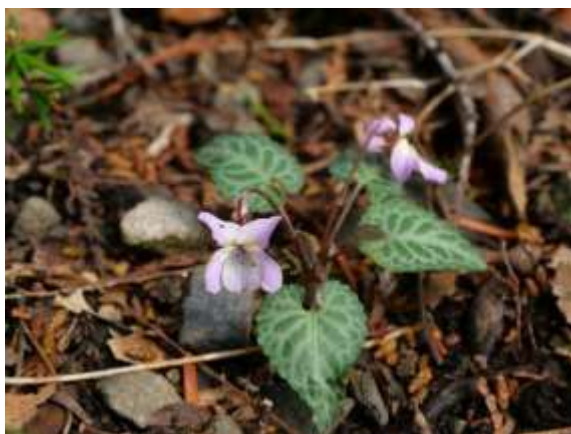
ヒナスマイレ（高尾山）