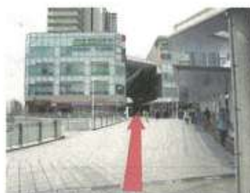
1.ボノ相模大野へ直進