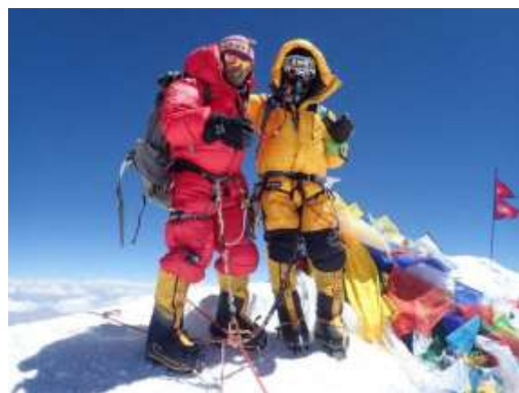
2018年5月18日エベレスト山頂にて

私が登山を始めたのは10歳の時に那須岳に登ったのが初めてでした。それ以来山に親しみ、今年で76歳になりました。もう66年かと思うと感慨深いものがあります。30近くまで、夏冬のバリエーションルートに挑戦し続けましたが、仕事もあり、一時は登山から遠ざかりましたが、55歳の時に一念発起して再開しました。ハイキング、縦走とレベルを上げ、冬山にも登れるようになりました。65歳で仕事を卒業してからは、ヒマラヤに挑戦するようになり、2016年にマナスル、2018年にエベレストに登る事ができました。今はGHT (グ