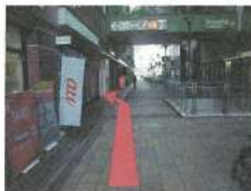
2.「ボノ横丁」看板を左折