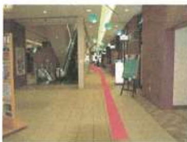
3.エスカレーターで上がる