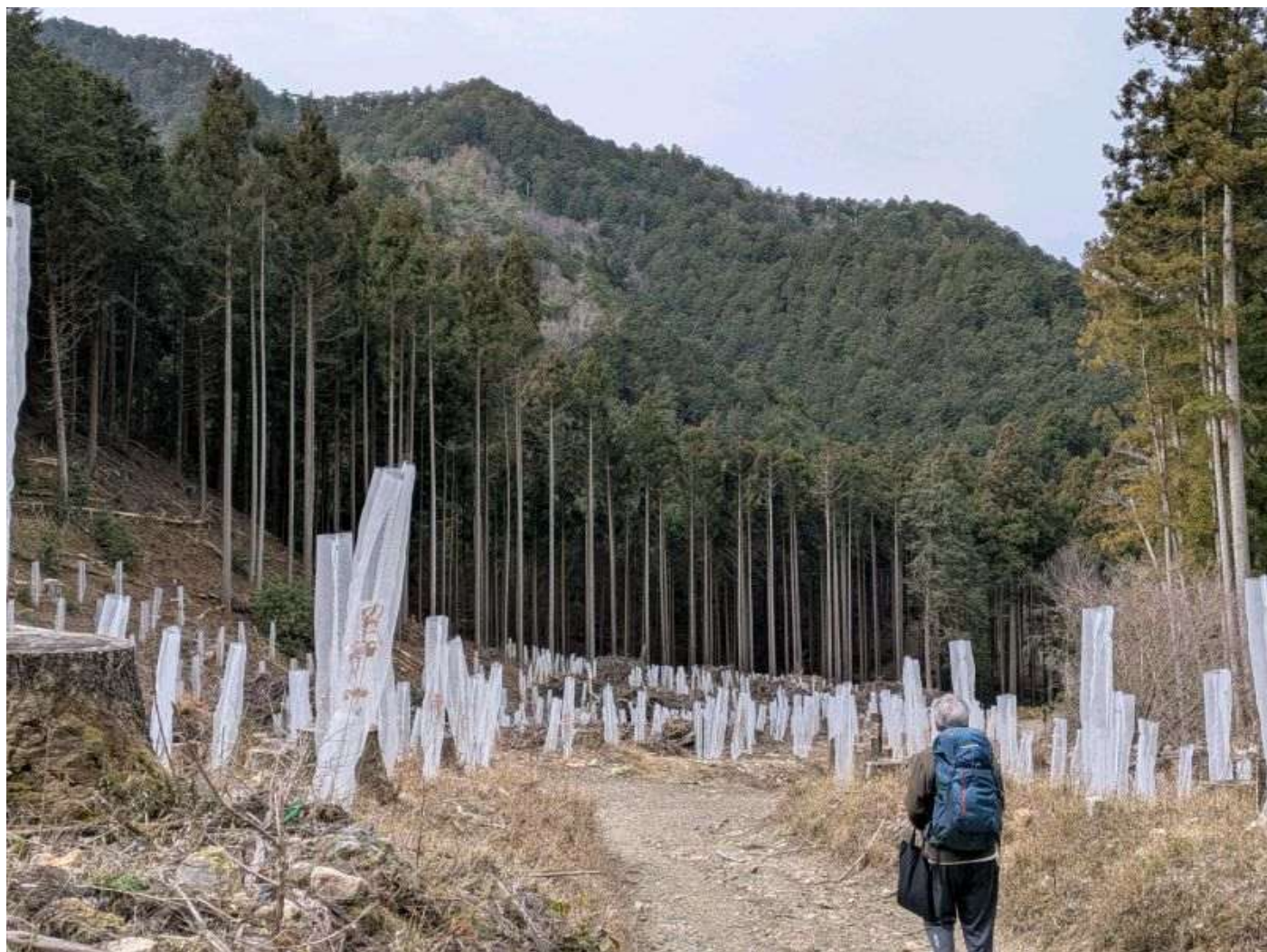
「京都一周トレイル・静原コース、苗木を保護するビニール袋の林」（川崎ハイキングクラブ）