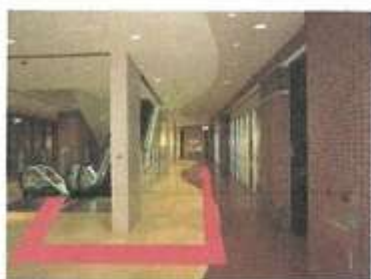
4.3階に上ったら、反対側にお回りください