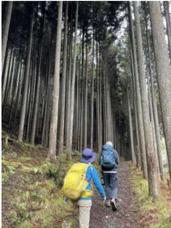
北山杉の中を歩く

鞍馬駅から叡山電車を出町柳駅に出て京阪電車に乗り換え九条駅で下車。小雨のなか徒歩でホテルに向かった。